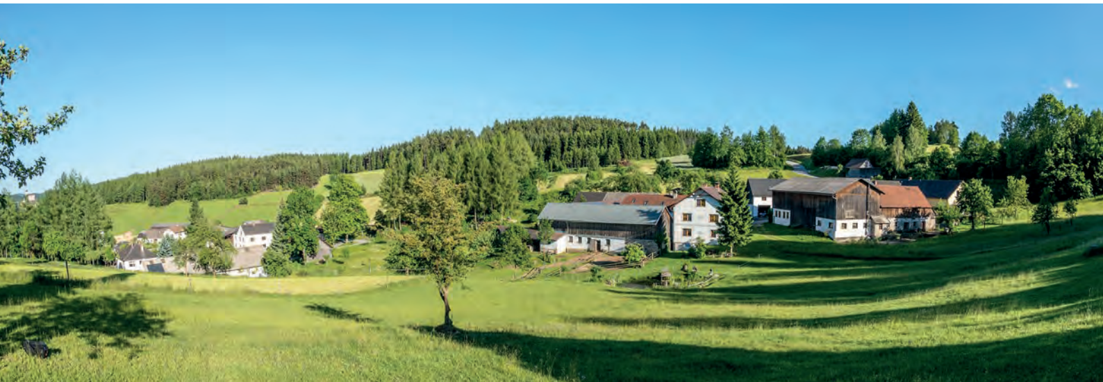
Bio-Dorf Klein-Nondorf bei Rappottenstein, Foto Hr. Ranger/Biohof Besenbäck