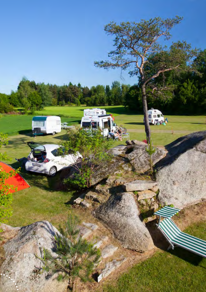
Foto Waldviertel Camping Einfalt Kinzenschlag/Groß Gerungs